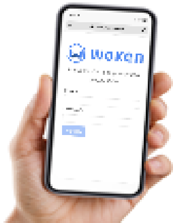
Paso 1 Ingreso a la Encuesta

La encuesta de salud de Woken permite conocer de manera fácil y sencilla los síntomas y condiciones que puedan indicar riesgo de contagio de Covid-19 , a través de una auto declaración de todos quienes ingresen a los centros de trabajo. Si la llena correctamente, todos apoyamos las medidas de prevención.